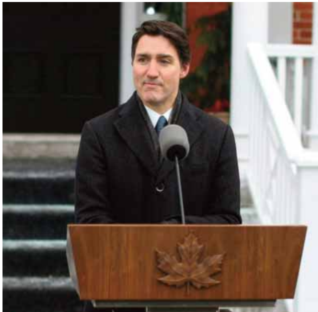
ਦਾ ਰਾਹ ਖੋਲ੍ਹਿਆ ਜਾਵੇਗਾ। ਇਸ ਮਤੇ ਨਾਲ ਲਿਬਰਲ ਸਰਕਾਰ ਨੂੰ ਨਵੀਂ ਚੁਣਾਵੀ ਮੁਹਿੰਮ ਵਿੱਚ ਜਾਣ ਲਈ ਤਿਆਰ ਹੋਣਾ ਪਵੇਗਾ।

ਜਸਟਿਨ ਟਰੂਡੋ ਦੇ ਅਸਤੀਫੇ ਦੇ ਐਲਾਨ ਤੋਂ ਬਾਅਦ, ਲਿਬਰਲ ਪਾਰਟੀ ਦੇ ਅੰਦਰ ਹੀ ਭਵਿੱਖ ਦੇ ਆਗੂ ਲਈ ਚਰਚਾਵਾਂ ਸ਼ੁਰੂ ਹੋ ਗਈਆਂ ਹਨ। ਅਜੇ ਤੱਕ ਕਿਸੇ ਨੇ ਅਧਿਕਾਰਤ ਤੌਰ 'ਤੇ ਆਪਣਾ ਨਾਂ ਪੇਸ਼ ਨਹੀਂ ਕੀਤਾ ਹੈ, ਪਰ ਕਈ ਸੀਨੀਅਰ ਆਗੂ ਪਾਰਟੀ ਦੀ ਲੀਡਰਸ਼ਿਪ ਸੰਭਾਲਣ ਲਈ ਤਿਆਰੀ ਕਰ ਰਹੇ ਹਨ। ਉਮੀਦਵਾਰਾਂ ਵਿੱਚ ਸਾਬਕਾ ਰੱਖਿਆ ਮੰਤਰੀ ਅਨੰਦ, ਸਾਬਕਾ ਗਵਰਨਰ ਮਾਰਕ ਕਾਰਨੀ, ਵਿੱਤ ਮੰਤਰੀ ਡੋਮਿਨਿਕ ਲੋਬਲਾਂ ਅਤੇ ਕ੍ਰਿਸਟੀਆ ਫ੍ਰੀਲੈਂਡ ਦਾ ਨਾਮ ਸ਼ਾਮਲ ਹੈ। ਕ੍ਰਿਸਟੀ ਕਲਾਰਕ, ਜੋ ਬ੍ਰਿਟਿਸ਼ ਕੋਲੰਬੀਆ ਦੀ ਮੁੱਖ ਮੰਤਰੀ ਰਹੀ ਹਨ, ਅਤੇ ਸਿਆਨ ਫੇਰਜ਼ਰ, ਜਿਨ੍ਹਾਂ ਹਾਲ ਹੀ ਵਿੱਚ ਟਰੂਡੋ ਵਿਰੁੱਧ ਬਗ਼ਾਵਤ ਕੀਤੀ ਸੀ, ਵੀ ਦਾਅਵੇਦਾਰਾਂ ਵਿੱਚ ਮਾਣੇ ਜਾ ਰਹੇ ਹਨ। ਟਰੂਡੋ ਦੇ ਅਸਤੀਫੇ ਦੇ ਐਲਾਨ ਨਾਲ ਵਿਰੋਧੀ ਪਾਰਟੀਆਂ ਨੇ ਆਪਣੀ ਤਿਆਰੀਆਂ ਤੇਜ਼ ਕਰ ਦਿੱਤੀਆਂ ਹਨ। ਤਿੰਨ ਵੱਡੀਆਂ ਵਿਰੋਧੀ ਪਾਰਟੀਆਂ ਨੇ ਕਿਹਾ ਹੈ ਕਿ ਜਲਦ ਹੀ ਸਰਕਾਰ ਵਿਰੁੱਧ ਬੇਭਰੋਸਗੀ ਮਤਾ ਪਾਸ ਕਰਕੇ ਚੋਣਾਂ