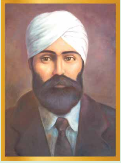
ਸ਼ਹੀਦ ਭਾਈ ਮੇਵਾ ਸਿੰਘ ਲੋਪੋਕੇ